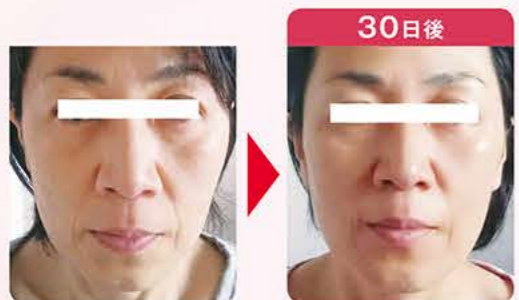
30日後 リフトアップし、ハリとツヤのある肌に♪(48歳)